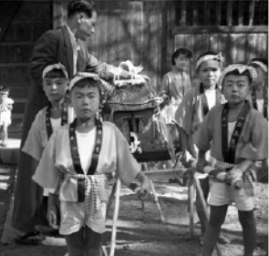
⑧神峯神社秋季大祭の子ども神輿