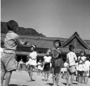
⑦安田小学校運動会