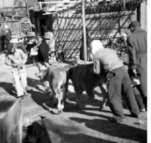
⑩売られていくあかうし