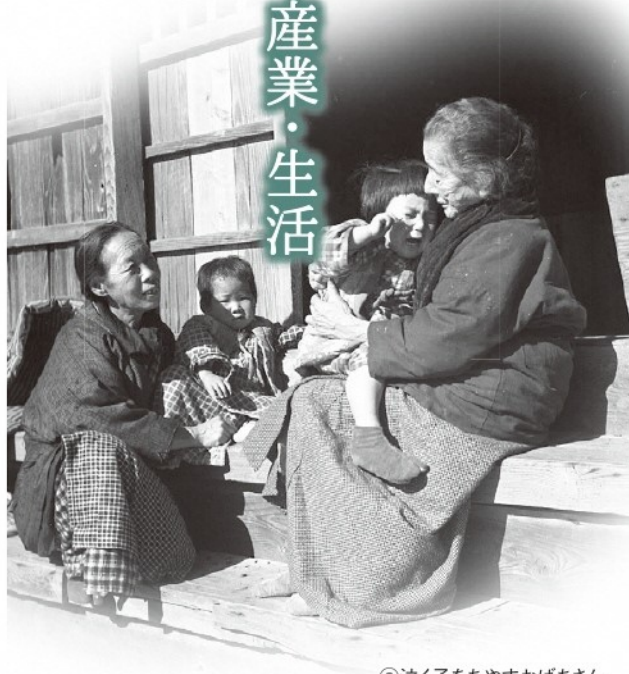
⑧泣く子をあやすおばあさん