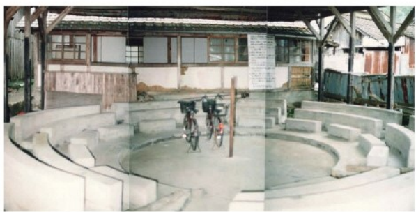
牛のせり市場（撮影者：西岡照郷氏、平成12年10月8日撮影）