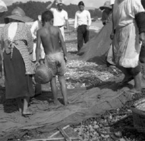
⑥唐浜に曳き上げられた地曳網