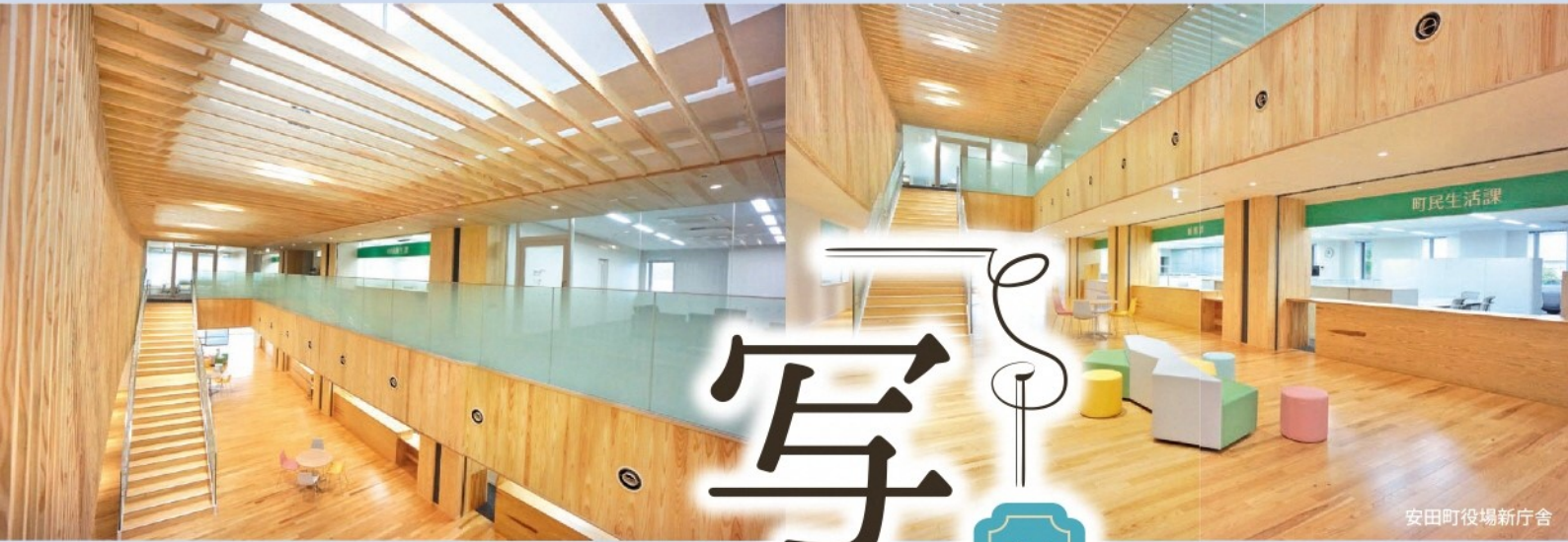
安田町役場新庁舎