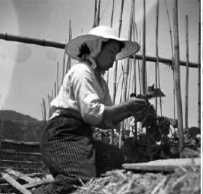
⑨きゅうり栽培の様子