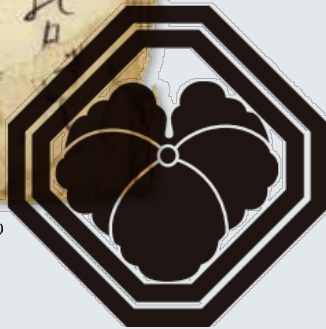
高松順藏著『採樵歌』より

高松邸を 度々訪れた龍馬は 縁側からいつも太平洋を 眺めていたという 逸話が残っている